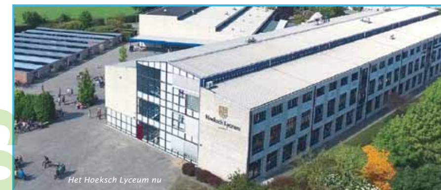
Het Hoeksch Lyceum nu

Het duurt nog even, maar de voorbereidingen zijn gestart voor de viering van het 100-jarig bestaan van het Hoeksch Lyceum in Oud-Beijerland.