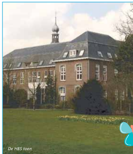
De HBS toen

De laatste mooie ontwikkeling op personeelsgebied is de in-company masteropleiding 'Educational Needs' die onlangs voor Acis-personeel van start is gegaan en waar maar liefst twintig medewerkers aan mee doen. Deze pittige opleiding is vooral gericht op het nóg beter herkennen en leren omgaan met gedragsproblematiek van leerlingen. Over twee jaar hebben we er dus heel wat gedragspecialisten op onze scholen bij. Voor wie niet meedoet aan de mastersopleiding is er bovendien nog het rijke nascholingsaanbod van de Acis Academie. Voor wie dacht dat Acis alleen de beste basis was voor leerlingen had het mis; dat geldt zeker ook voor het personeel.