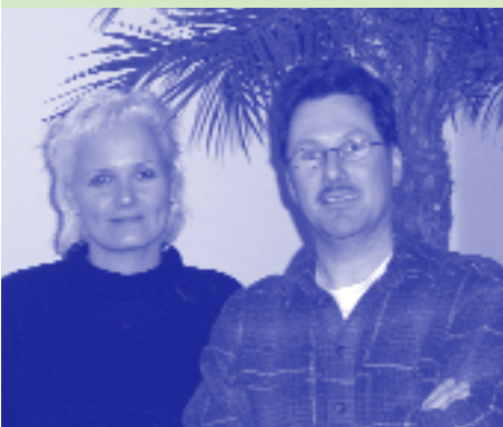
Dagelijks bestuur GMR.

De GMR vergadert op genoemde data van 20.00 - 22.00 uur in het kantoor van de Stichting ACIS in Mijnsheerenland. Deze vergaderingen zijn voor iedereen toegankelijk.