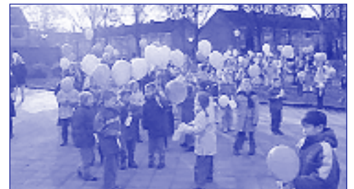
De ballonnenwedstrijd bij o.b.s. De Schelf in 's-Gravendeel