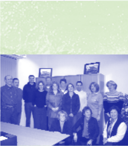
Het 14 leden tellende team van de GMR.