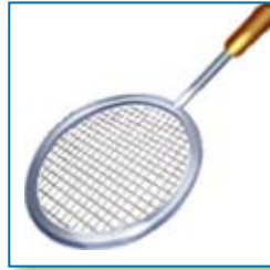
sport en spel