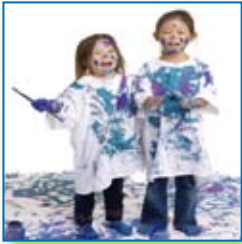
schilderen van de school

De naam Patrijspoot verdwijnt na ruim 30 jaar en de naam Striene na ruim 95 jaar. Een belangrijke mijlpaal voor een groot afscheid. Tijdens de feestweek waren er allerlei activiteiten: