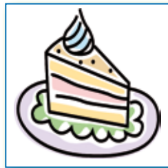
eten en drinken